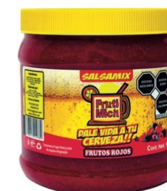
Frutos Rojos Pop